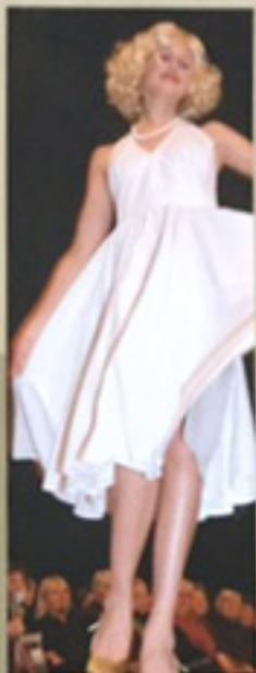
Pa Hundredørvævingen, inspirert av Valhall Bortne på 1905.