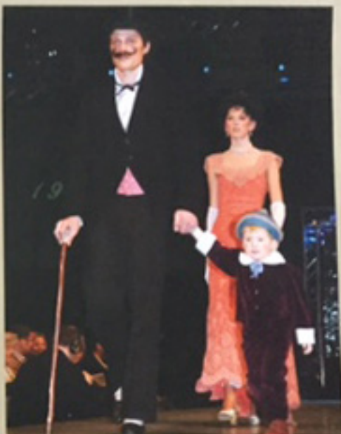
Pa Hundredørvævingen, kåret til beste foredrag 1905.

serne kollektorer fra ulike foreninger (De Dale of Norway til Læsting og Carlen Kjøtt, samt egen jernstensmessig).