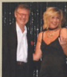
Arrangøren var delt ut av Perter Stoveland og gitt ut en gjeste gjeste Pa Spjøck.