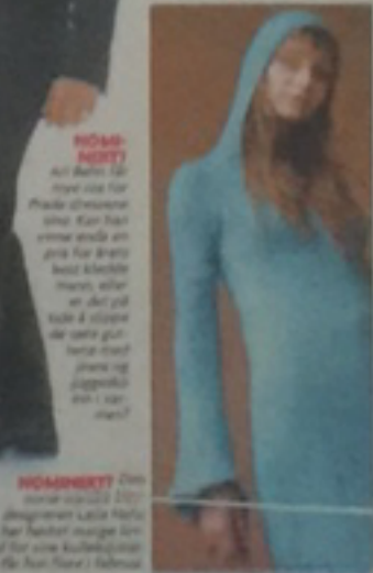
NOMINEERT Den nye moteprisen er et samarbeid mellom Nationalmuseet og Oslo Museum.