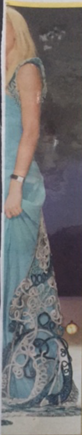
Rocco Vers: Gunilla Holm i en vakker øyde.