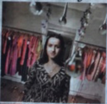
Medlemskap i den beste motebransjen i verden. Dette er et stort ansvar, og det er viktig å være klar på dette tidspunktet.