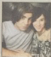
EVYKKELAG: Popstjerne Faith Aidun med sin kjæreste Svein Kvaløy.